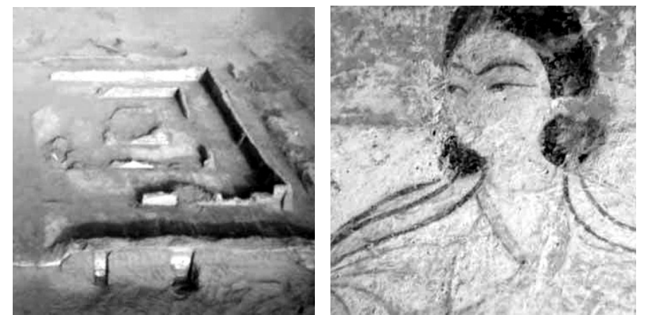
중국 고고학자들이 발견한 1500년전에 지어진 불교사원의 유적(좌)과 간다라 양식의 벽화(우).