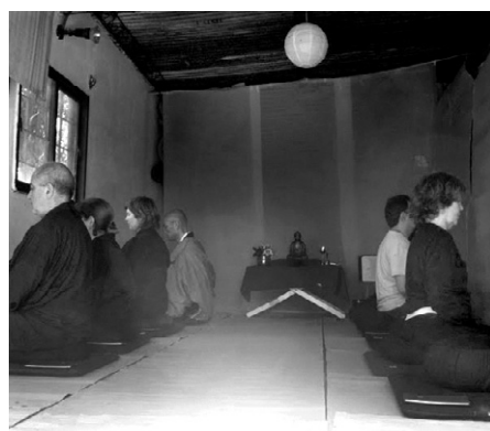
부에노스아이레스의 일본문화원 내에 있는 소토선불교협회는 현재 불교철학 강좌를 개설, '선실수'를 실시하고 있다(좌). 푸엔테 카사칼레스(Puente Cascallares)에 위치한 에코요가공원에서 수업을 하고 있는 수련생들(우).

부에노스아이레스 근교인 푸엔테 카사칼레스(Puente Cascallares)에 위치한 에코요가공원은 부에노스아이레스에서 '요가 캠프장'으로 통한다. 유기농 아침 식사를 시작으로 시작되는 이곳의 수업은 티베트 불교의 벨 명상(Tibetan Bell Meditation)과 동서양의 고전음악을 들으며 진행하는 만트라 치유(Mantra