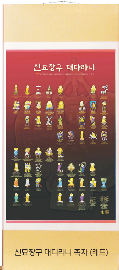
신묘장구 대다라니 족자 (레드)

42수 진언을 귀자 형상으로 배치하여 천수천안 관세음보살님의 위신력을 발휘하도록 하였습니다.