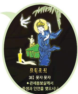
신묘장구 대다라니 족자 중의 '못자못자' 확대사진