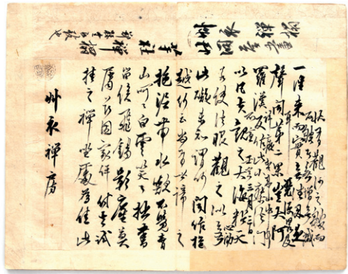
제주 유배초기 1842년 3월에 쓴 추사의 편지 <백해타운첩>