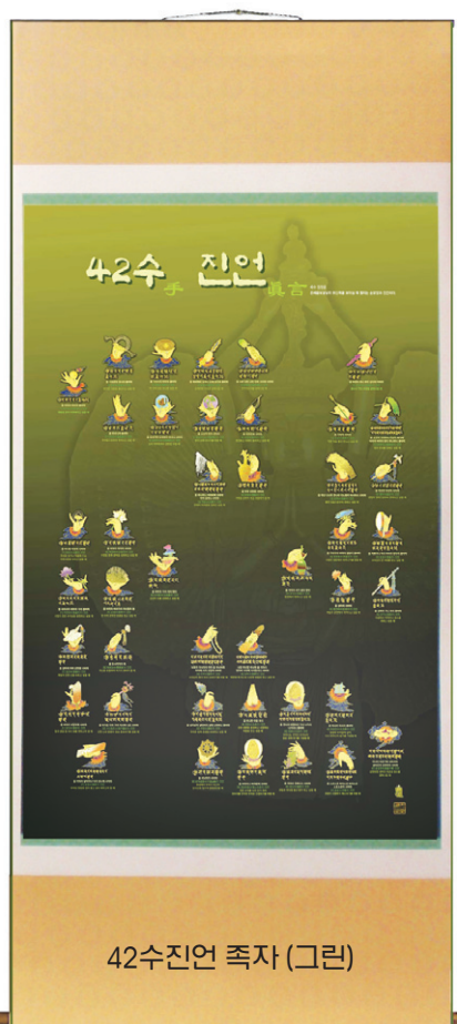
42수진언 족자 (그린)