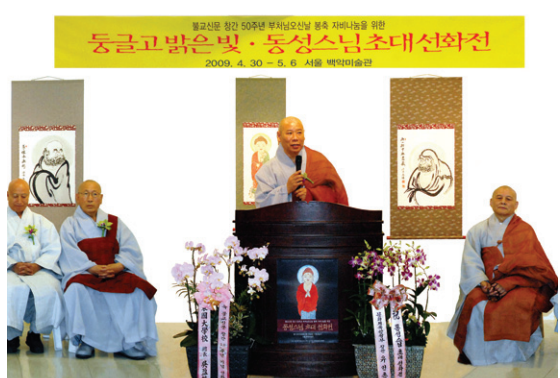
2009년, 백악미술관 개인전의 수익금 전액을 공익기부재단 아름다운 동행에 기부하는 보시행을 실천했다.

스님은 오늘도 수행의 세계 그 동글고 밝은 빛을 이루어 가기 위해 선화의 세계에 빠져들 것이다. 그렇게 동성 스님은 붓끝으로 부처님 진리의 세계로 다가가고 있었다. 글:정혜숙 기자 bwjhs@hyunbul.com