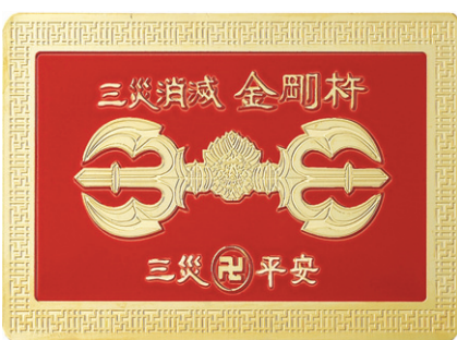
삼재무탈하게 축원불공마쳐 삼재화를 소멸 승리하는 비방

2013년 드는 삼재 2014년 묶는 삼재 2015년 나가는 삼재 양띠, 토끼띠, 돼지띠 중생들은 2015년 말까지 3년간 삼재기간으로 각별히 조심하고, 공덕을 쌓으며, 자중 자애하는 마음으로 조용히 지내는 것이 좋다. 지난 쥐띠, 용띠, 원숭이띠 삼재기간 중에 삼재화로 건강으로 고통 받고 삼재관재수로 법적인 문제에 휘말리며, 삼재액운으로 사업이 어려워지고 재산을 소진하며, 가정이 파탄되고 하는 일마다 뜻대로 되는 일이 없으며 갖가지 어려운 고통 속에 삼재화를 당하는 중생들을 주변에서 많이 보아왔다.