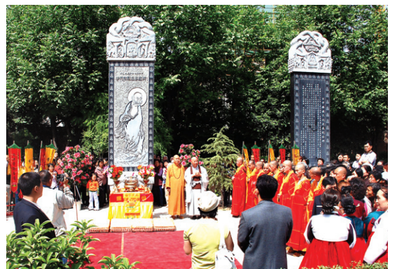
2006년 중국 시안 대홍선사에 세계 평화를 기원하는 사문동 성달마화비를 건립했다.