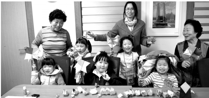
전주서원노인복지관 어린이교실에서 할머니와 아이들이 밝게 웃고 있다.

“할아버지 옛날 이야기 해주세요” “할머니 종이 가면 만들어 주세요” 어린이들의 재롱과 웃음소리로 주위 어른들이 이용하는 노인복지관이 웃음과 활기로 가득했다.