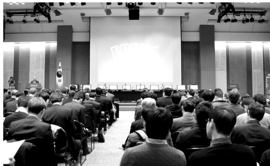
3월 12일 프레스센터에서 열린 불교생명윤리협회 창립 1주년 기념세미나