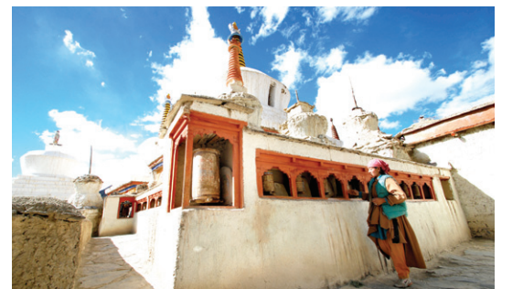
라다키 여인이 탑돌이를 하고 있다.

해발 3500미터에 자리 잡고 있어 ‘하늘 도시’라는 낭만적인 별명을 갖고 있는 라다크의 중심도시 라레는 중앙아시아와 인도를 오가던 카라반들이 모여 들던 고산지대 교역로의 주요 거점지였다. 라다크의 문화나 관습, 종교적 특징은 전통적으로 티베트에 가깝다. 특히 1974년에 이르러서야 처음 외국에 개방된 덕에 라다크의 독특한 전통, 특히 티베트불교의 특징은 정작 티베트보다도 더 잘 보존돼 있다는 것이 학자들의 견해다. 하늘과 땅, 사람과 자연, 그들의 신심과 삶이 하나된 거대한 꽃다발 같은 라다크. 희박한 공기 탓에 더 푸르게 빛나는 하늘과 만년설, 풀 한 포기 없이 황량한 산과 그 거친 환경 속에서 묵묵히 삶을 이어온 사람들, 그들이 지켜온 티베트불교문화 등 ‘미래’로 남겨두어야 할 라다크