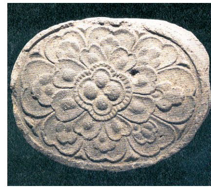
그림③ 월성출토 타원형 의당, 씨방 부분에 사면보주가 있다.