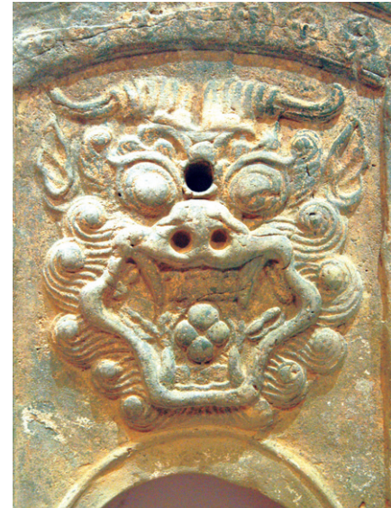
그림② 용머리, 입에 사면보주가 있다.