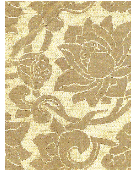
그림① 신경유씨 복식 세부, 씨방을 사면보주 모양으로 만들었다.

어버리며, 그 오류를 증명하여 고쳐서 설명하면 알아듣지 못하여 받아들이지 못한다. 그 까닭은 틀린 용어를 쓰는 사람은 틀린 삶을 살기 때문이며, 따라서 올바른 용어와 설명을 들려주면 차원이 높은 내 용이어서 이해하지 못한다는 것을 알았다. 그러므로 학문하는 사람은 교양 있고 차원 높은 삶을 항상 추구해야 한다. '아무 것도 모르는 사람이 써야 아무 것도 모르는 대중이 이해하기 쉽다 현실'에 크게 실망한 적이 있다. 중요한 내용을 아무리 정성껏 증명하여 써도 이해하기 어렵다고 한다. 단지 평생 단순한 사실만을 지식으로 축적하여 왔기 때문이다. 사고력의 상실이고 영성(靈性)의 상실이다. 본질과는 관계없는 에피소드만을 써 달라고 원고 청탁하는 경우가 점점 많아지고 있다. 사회가 천박해 지고 있는데, 예술작품은 어떤 의미에서 문자언어로 전해지는 종교사상보다 정신적 차원이 더 높고, 함유하고 있는 상징이 더 심원하므로 일상생활은 점점 진실과 멀어져 간다.