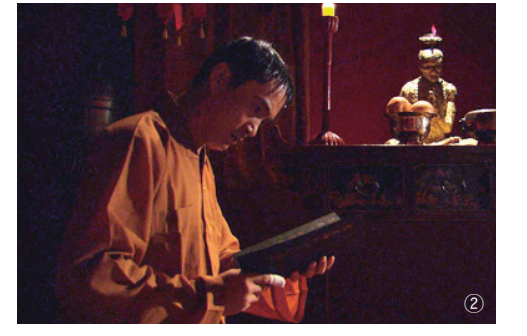
①올해로 탄생 100주년을 맞는 김동리 작가의 생전 모습. ②KBS TV문학관에서 드라마로 방영됐던 '등신불'의 한장면 ③초대 한국불교아동문학회 회장을 지냈던 김동리 작가가 불교글짓기 대회에서 시상식을 진행하고 있다.