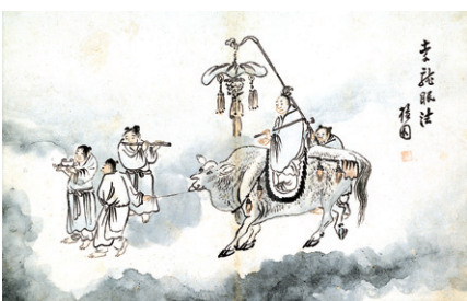
김홍도 작 '구름위의 신선들'

국립춘천박물관(관장 최선주)은 4월 14일까지 '명품순례, 봄을 찾아온 동자'전을 개최한다.