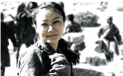
Where's the Heart Blossoms 젤상추키 2집 '화개시절' 표지

티베트의 국민 여가수 젤상추키의 2집 앨범 '화개시절'이 한국에서 발매 됐다. 화개시절에는 감로와 다와돌마 등이 한국인에게 가장 사랑받는 노래가 담겨 있다. 티베트 전통민요와 찬불가뿐만 아니라 티베트 애국가와 창작곡들까지 총 12곡이 담겨 있다. 티베트 전통악기와 추키의 목소리가 피아노, 첼로, 기타 등 현대악기와 절묘하게 조화를 이룬다.