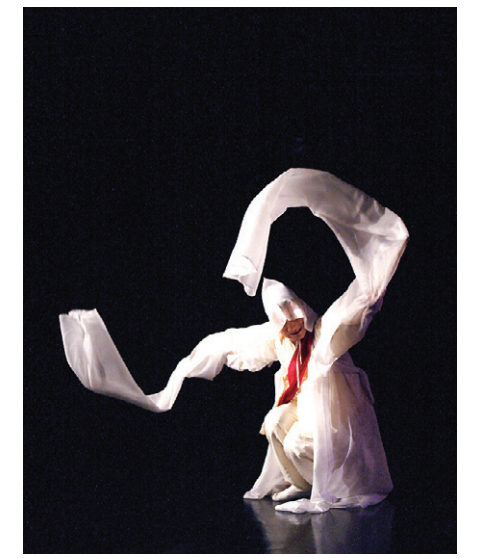
이철진 씨는 108일 동안 승무 공연을 펼친다.