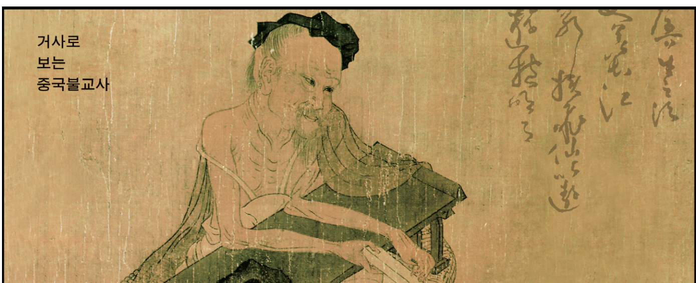
거사로 보는 중국불교사