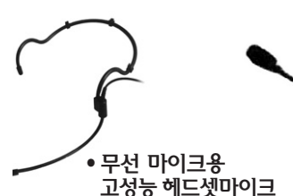
•무선 마이크용 고성능 헤드셋마이크

◆특징 : 자체 제작하는 스피커로 소리가 웅장합니다. 핀 마이크와 잘 맞습니다.