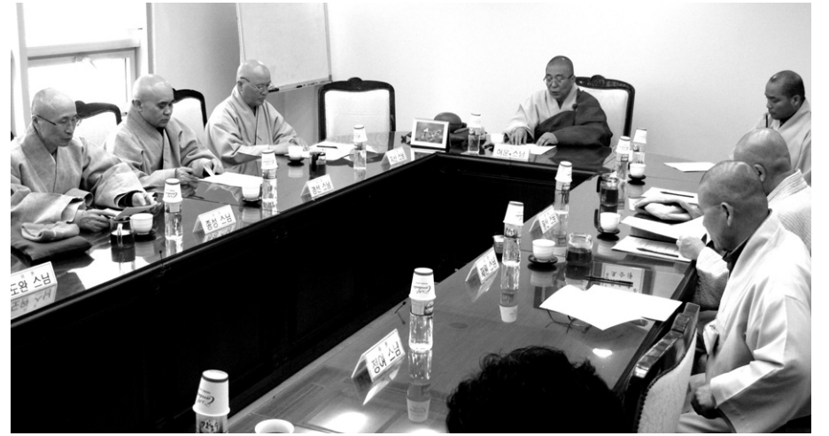
3월 15일 열린 조계종 법규위원회 제78차 긴급 회의. 이날 법규위는 위원장 사임과 일련의 사태에 대해 유감을 표명하는 입장문을 발표하기로 결의했다.

은 조항은 과거 법규위원회가 사법처분에 대해 관여하면서 논란이 돼 관장사항을 명확히 정의한 것”이라며 “그러나 법규위원회가 의현 스님의 청구를 다루기 위해 종헌 규정을 무리하게 확대·적용했다”고 지적했다.