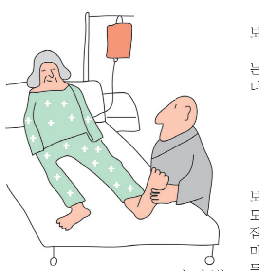
그림 · 박구원

관세음보살... 관세음보살님, 이 분을 알면 대려가소서, 고통없이 관히 데려가소서. 발을 주무르며 관세음보살님을 불렀다.