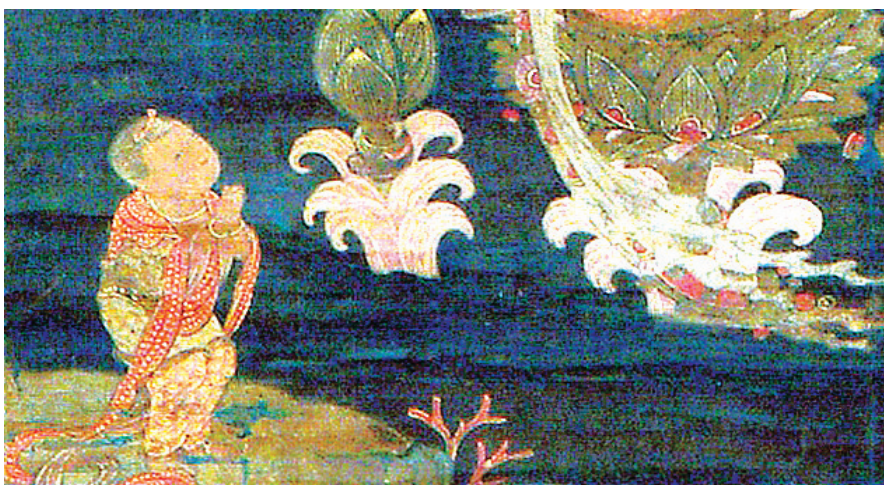
고려불화 수월관음도(사진 위)에는 수월관음 이외에도 이를 예경하고 있는 선재동자의 모습을 찾을 수 있다. <사진 아래> 어머니처럼, 공기처럼 우리 곁에 있는 보살의 자비는 사바세계의 중생들을 선재동자로 만든다.

자의 자비이기에, 그것은 우리를 여러광만 피우는 어린아이가 아니라 가장 순수하고 가장 깊은 내면에서 본 어린아이로 돌아가게 한다.