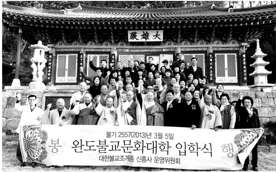
완도 불교문화대학 입학식에서 불자들이 활발한 포교활동을 다짐하며 화이팅을 외치고 있다.