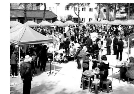
보물섬 장터의 인산인해 장면

이날 개장식에는 무각사 주지 청학 스님을 비롯해 천주교 광주대교구 김희중 대주교, 개신교 정관재 목사, 김종식 광주