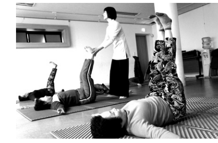
안산골문화관에서 마을 주민들이 요가 강좌를 듣고 있다.