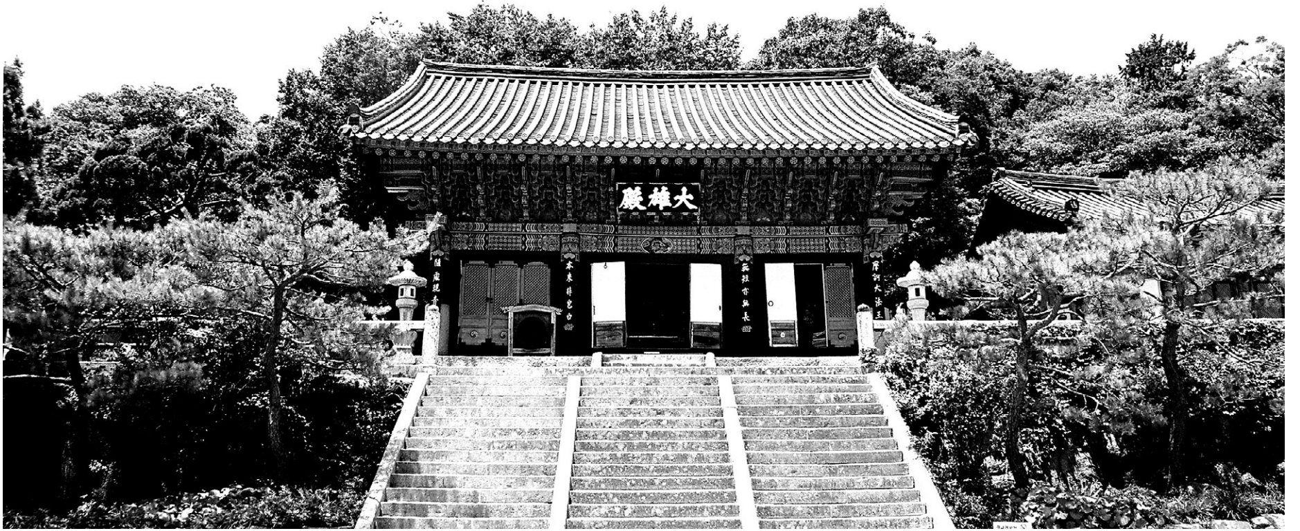
현재 범어사의 전경. 1912년 만해 한용운 스님을 비롯해 임제종 운동에 참여한 스님들은 2차 총회를 열고 범어사에 임제종 임시 종무원을 둘 것을 결의했다. 하지만 얼마 가지 않아 일본 총독부의 탄압이 시 작됐고, 결국 문을 닫게 됐다.