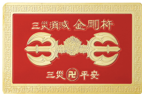
삼재무탈하게 축원불공마치 삼재화를 소멸 승리하는 비방

2013년 드는 삼재 2014년 복는 삼재 2015년 나가는 삼재 양띠, 토끼띠, 돼지띠 중생들은 2015년 말까지 3년간 삼재기간으로 각별히 조심하고, 공덕을 쌓으며, 자중 자애하는 마음으로 조용히 지내는 것이 좋다. 지난 쥐띠, 용띠, 원숭이띠 삼재기간 중에 삼재화로 건강으로 고통 받고 삼재관재수로 법적인 문제에 휘말리며, 삼재액운으로 사업이 어려워지고 재산을 소진하며, 가정이 파탄되고 하는 일마다 뜻대로 되는 일이 없으며 갖가지 어려운 고통 속에 삼재화를 당하는 중생들을 주변에서 많이 보아왔다. 양띠, 토끼띠, 돼지띠 생들은 드는 삼재가 제일 어려운 시기이므로 자만심을 버리고 비방을 하는 것이 안전