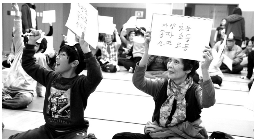
자양종합사회복지관은 온 가족이 함께하는 '도전 골든벨'을 실시했다.

불교계 복지관들이 정월대보름을 맞아 한 해의 건강과 행복을 기원하는 다채로운 행사를 진행했다.