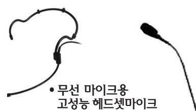
·무선 마이크용 고성능 헤드셋마이크

·특징: 자체 제작하는 스피커로 소리가 웅장합니다. 핀 마이크와 잘 맞습니다.