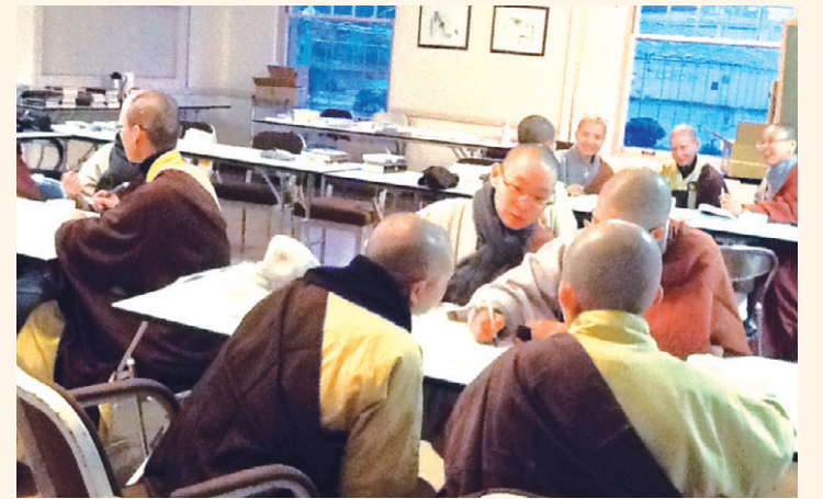
미국 연수에서 만포도시 스님들과 토론하는 모습