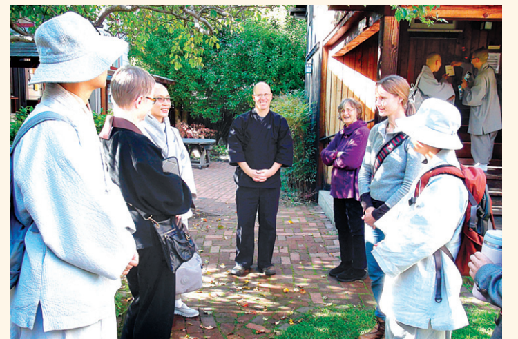
2012년 7월 미국 버클리센터 수행자들과의 대화 모습