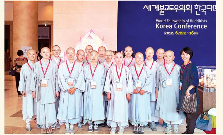
2012년 6월 WFB 세계불교도 우의회에서 영어 통역 봉사단 활동 당시 모습