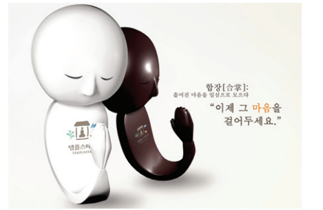
제5회 불교문화상품 공모전 대상에 선정된 정경은 씨의 '그 마음을 걸어주세요'.

이와 함께 이번 공모전은 이전 보다 참가 인원과 작품이 늘어 눈길을 끌었다. 작품 수는 총 550점이 접수됐으며, 이는 전