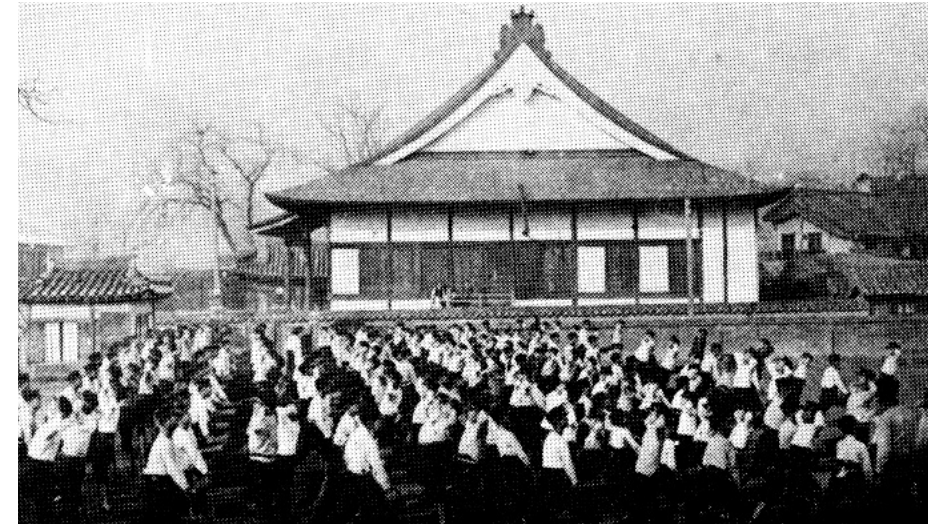
1910년 조선불교중앙회소 겸 중앙포교소로 활용되었던 각향사 전경. 원종종무원의 설립인가를 받기 위하여 당시 중정인 이회광은 여러 가지 노력을 하였다.

고 이회광 스님의 성향으로 미루어본다면 그 출발부터 친일적 성향을 배제할 수 없으며, 궁극적으로 한국불교의 발전이나 독자성 실현은 엄연한 한계를 지니고 있었던 것이다.