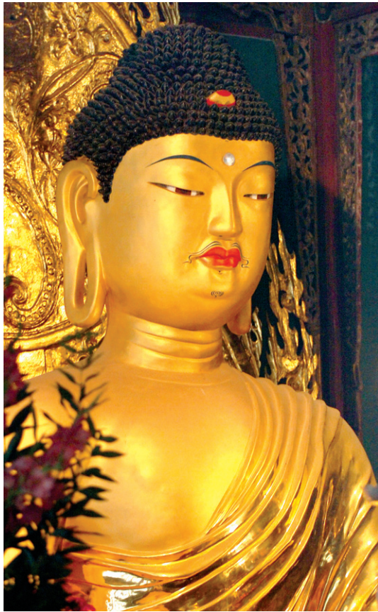
부석사 무량수전 아미타불

염불이란 원래 부처님을 마음속으로 부르는 것을 말한다. 자세히 말하면 부처님의 이름, 모습, 지혜, 공덕 등을 생각하여 잊지 않는 것을 염불이라고 한