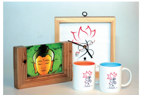
김용덕불교일러스트연구소의 디자인 용품들.

시하고 인터넷 쇼핑물 붓다이미지(www.buddhaimage.kr)를 개설했다.