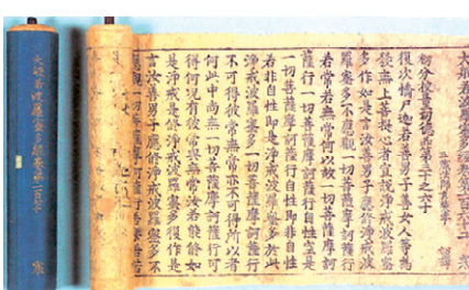
국보 제 284호 '조조본대반야바라밀다경'

개관 10주년을 맞은 코리아나 화장박물관(관장 이상욱)이 5월 31일까지 코리아나 화장박물관 소장 대표 유물을 만나볼 수 있는 '名品'전을 개최한다. 특히 이번 전시에서는 조조본대반야바라밀다경(初雕本大般若波羅蜜多經)과 '대방광불화엄경(大方廣佛華嚴經)'이 공개된다.