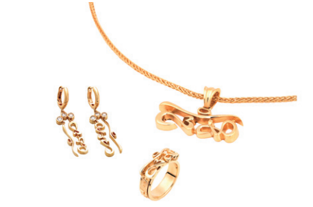
주얼리 업체 파파라차의 버드옴세트.

김용덕불교일러스트연구소 역시 최근 컵 시계 액자 등과 관련된 불교 용품을 출