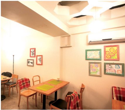
갤러리카페 전시 전경

치매 어르신들이 만든 작품이 전시돼 눈길을 끈다. 치매·중풍 등 노인성 질환 어르신을 위한 전문노인복지시설 보현데이케어센터는 치매 어르신들의 그림을 전시한다.