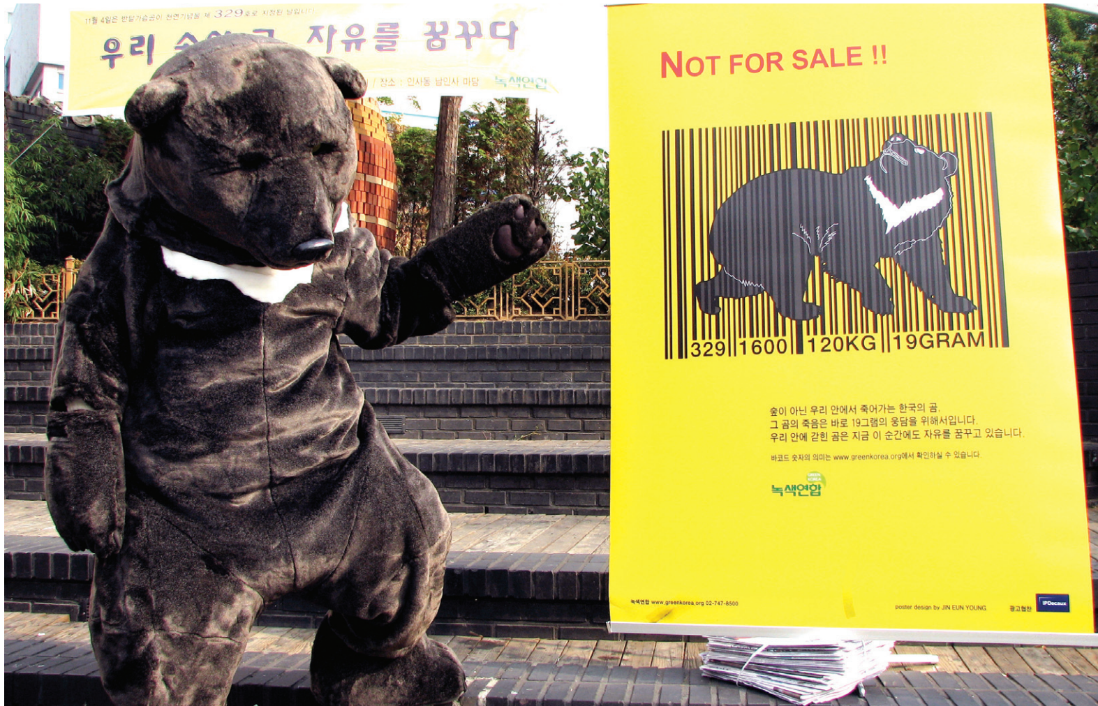
녹색연합이 진행한 곰 사육 반대 캠페인. 적지 않은 수의 곰이 약용을 위해 매년 희생되고 있다. 모든 생명들이 행복해질 수 있는 방법은 인간의 욕망을 줄이는 것이다.

최근 광우병, 신종플루, 조류독감 등 신종전염병들은 대부분 사람과 동물이 같이 전염되는 인수(人獸)공통전염병으로 심각한 문제가 되고 있다. 이러한 전염병은 잔인한 사육환경에서 비롯되었다고 분석한다. 따라서 이들 동물들이 행복하게 살수 있는 권리에 관심이 높아지고 있다.