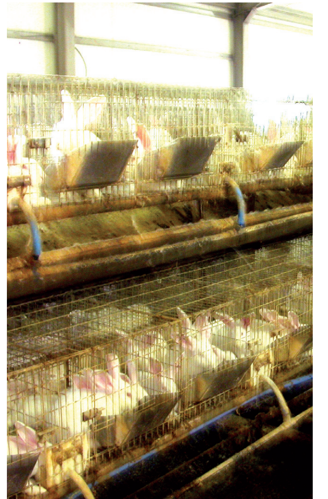
비위생적이고 폐쇄적인 공간에서 사육되는 동물들. 조류독감 등 신종전염병들은 잔인한 사육환경에서 비롯됐다.