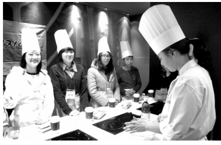
기업인, 법조인, 교육인 등 자원봉사자들이 자신의 일터로 아이들을 초청해 일과 경험 및 삶의 과정을 들려준다. 최근에는 플로리스트, 승마관리사, 바리스타 등 다양한 직업의 세계도 소개하고 있다.