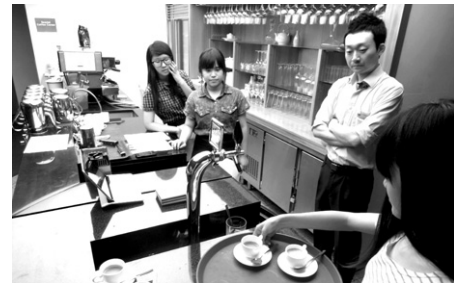
기업인, 법조인, 교육인 등 자원봉사자들이 자신의 일터로 아이들을 초청해 일과 경험 및 삶의 과정을 들려준다. 최근에는 플로리스트, 승마관리사, 바리스타 등 다양한 직업의 세계도 소개하고 있다.