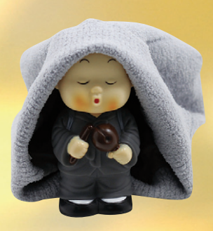
02 화이바 겨울모자 40,000원