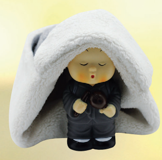
01 귀달이 양털모자 63,000원