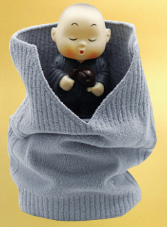
03 화이바 넥워머 32,000원