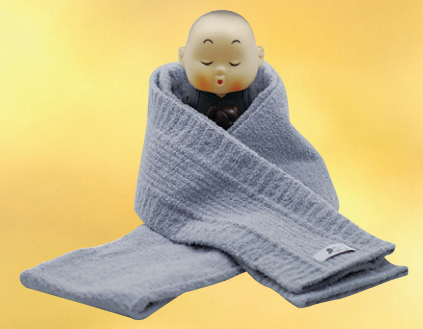
04 화이바 목도리 63,000원