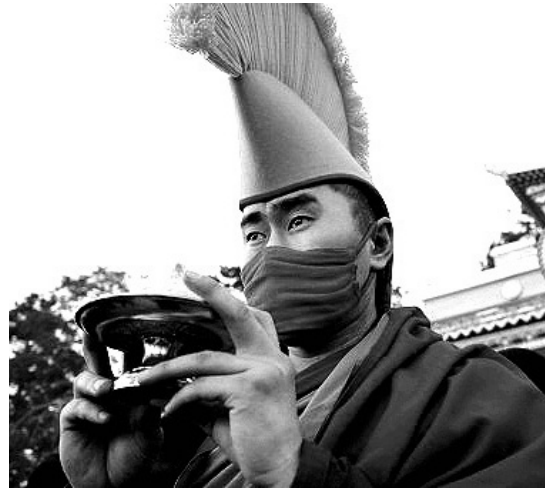
칼미키야 엘리스타(Elista)에 있는 불교사에서 봉행된 올해 음력 설 맞이 법회.