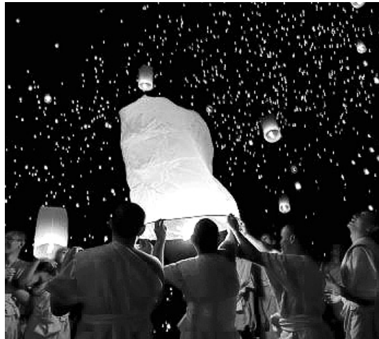
칼미키야 불교계가 백월(White Moon) 축제 프로그램으로 선보인 '연등 날리기' 행사.

투바의 올해 샤가의 하이라이트는 '햇불 순례(The Lighting of Fire)'. 이는 청장년 불교도들이 햇불을 들고 투바의 수도 키질(Kyzyl)의 주산인 도기(Dogee) 산을 오르는 것이다. 투바온라인은 "1킬로미터 남짓한 순례 빛발에 지역주민은 물론 관광객 역시 크게 환호했다"고 보도했다.