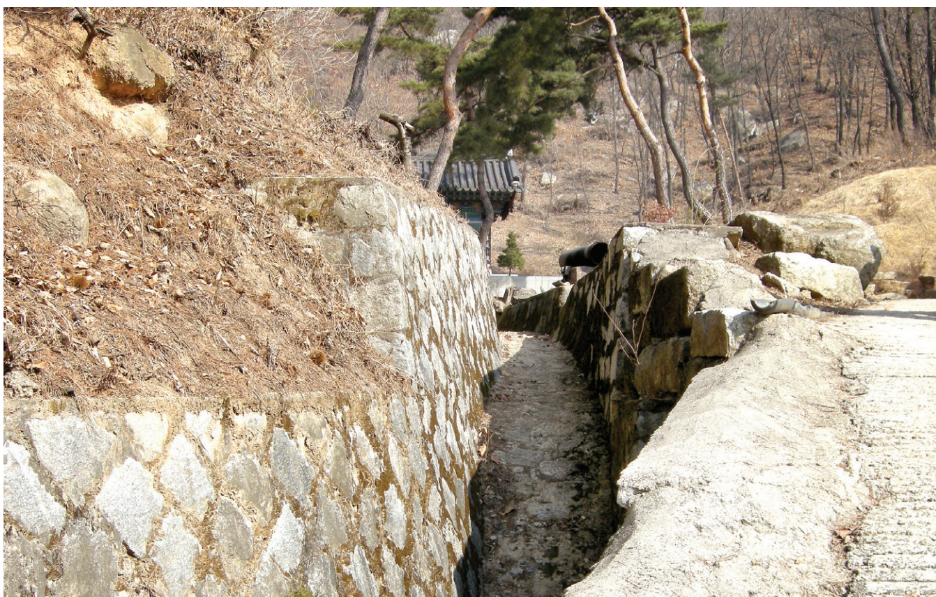
자연수로의 현상을 변경하는 일은 사찰의 자연성을 파괴하는 일이다. 경기도 8사찰