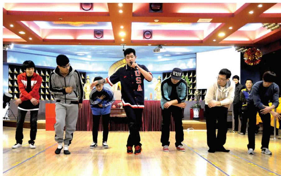
부산보리선수에서 개최된 '2013년 국제 청년 법회'에서 한국 B-boy들에게 중국 청년들이 춤을 배우는 시간을 갖고 있다.

부산 보리선수(주지 범생)는 설을 맞아 한·중 청년 교류를 위한 '2013 국제청년법회'를 개최했다. 2013년 2월 6일~2월 12일 부산 해운대 보리선수 법당에서 개최된 이번 행사에는 한·중 청년 200여명이 참석한 가운데 수행, 단체토론, 설날 파티, 가면무도회 등 다채로운 행사가 진행됐다.