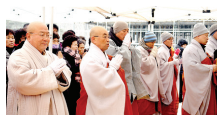
영천 은혜사 템플스테이교육관 상량식 장면

조계종제 10교구본사 영천 은혜사는 2월 12일 템플스테이교육관 대법륜전 상량식을 가졌다. 이 자리에는 정각원 법타스님, 조실 해인 스님, 중앙박물관장 원학스님, 돈명 스님, 돈관 스님 외 300여명의 사부대중이 동참했다.