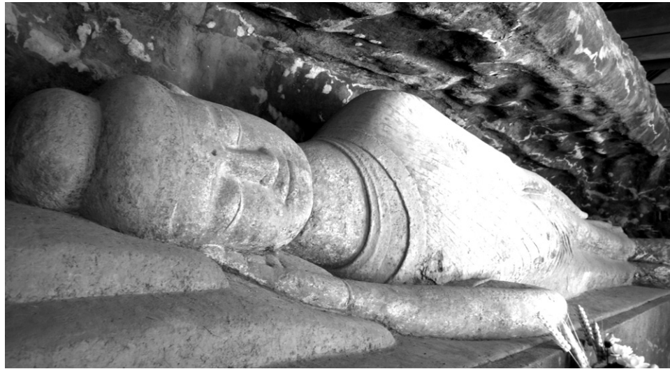
란주 병행사의 부처님 열반상 모습이 고요하고 평화롭게 느껴진다.

이 책의 주 무대인 실크로드(Silk Road)는 독일의 지리학자 리히트호펜(Richthofen)이 처음 사용했다. 이는 고대 중국과 서역 각국 간에 비단을 비롯한 여러 가지 무역을 하면서 정치·경제·문화종교를 이어준 교통로를 말한다. 구체적으로는 중국 장안(지금의 시안)에서 타클라마칸사막, 파미르코원, 중앙