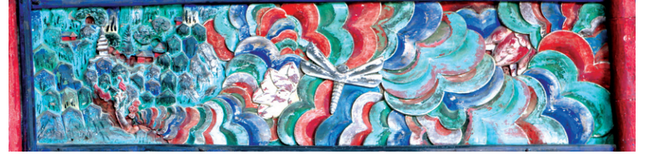
그림 ②-2 불단 마지막 부분의 중단부