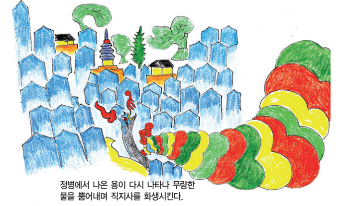
그림 ④-2 (그림 ③-2)을 채색분석한 것

육각수문(六角水文)이 나와서 여래가 봉안된 사찰이 화생하는 맥락을 명확하게 짚어볼 수 있다.(그림 ④-2)