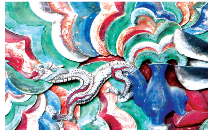
그림 ③-1 정병에서 나오는 용과 영기문