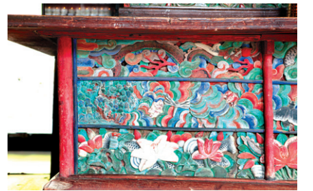
그림 ①-2 불단의 왼쪽 마지막 부분