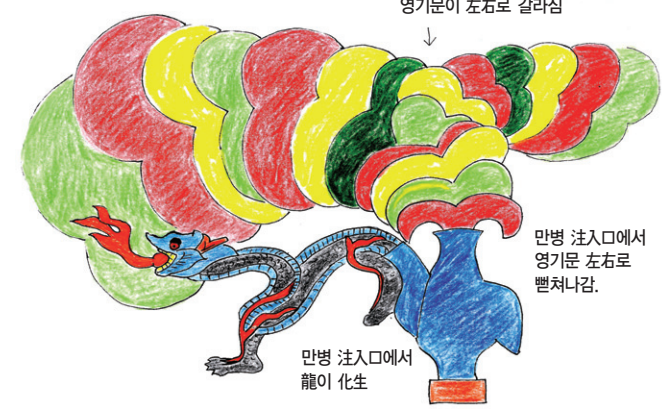
그림 ④-1 (그림 ③-1)을 채색분석한 것