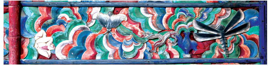
그림 ②-1 불단의 처음 부분의 중단부