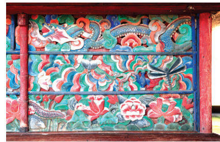
그림 ①-1 불단의 오른쪽 처음 부분

그리고 용으로부터 무량한 물이 솟구쳐 나오는데, 그것을 중첩된 육각형 바위 모양으로 나타냈다. 육각은 물을 상징한다. 그러니까 정병에서 용이 나오고 용의 입에서 보주와 무량한 물(수많은 암석 같은