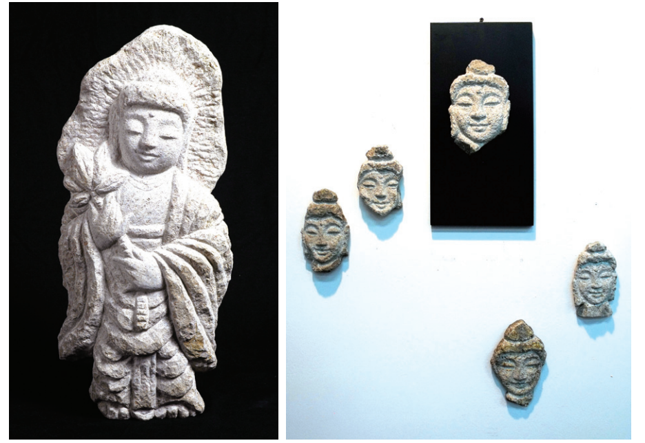
다양한 불상 조각으로 한국 문화를 세계에 알리고자 하는 오채현 작가는 3월 14~17일 홍콩아트페어에 참가한다. 작품 왼쪽은 '염화미소' 오른쪽은 '해피부트'

이번에 홍콩아트페어에 전시될 '해피부트'를 한 해 오채현 작가의 행보는 바쁘다.