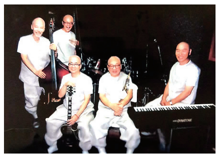
밴드 우담바라는 8명의 스님으로 구성됐다.

8명의 스님으로 구성된 밴드 '우담바라'가 결성돼 화제다. 대구 능인선원 주지 혜장 스님을 단장으로 지난해 7월 오디션을 거친 8명의 스님으로 멤버를 구성, 지난 스님과 지연 스님이 보컬을 맡았다.