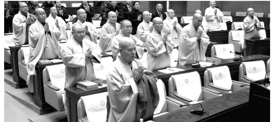
조계종 결사추진본부는 2월 6일 운영회의를 열고 올해 사업기조와 예산을 확정했다.

또한 법계에 따라 승려의 지위와 역할을 부여하고 종단 소임에 대한 자격제도를 정비함으로써 인재의 적재적소에 배치할 수