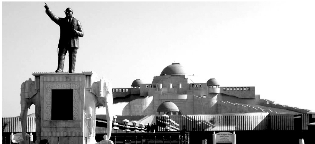
암베드카르 우디안 기념관 (Ambedkar Udyan Memorial). 코끼리 위에 암베드카르가 서있다.

많은 시선을 보내고 있는 것이 사실이다. 힌두교 관련 정당들은 불가지족민들의 개종을 종교와 관련 없는 단순한 정치행위로 매도하고 있고 언론들도 그 순수성에 의문을 제기하고 있다. 심지어 기존의 불교도들도 그런 식으로 열리는 개종식이 진정한 불교로의 입문식이라고 할 수 없다는 의견과 함께 불교가 정치적으로 이용될 수 있다는 불안감을 표현하고 있다. 그리고 대규모 개종식 이후 새로이 불교도가 된 이들에 대한 후속조치 또한 미흡하다.