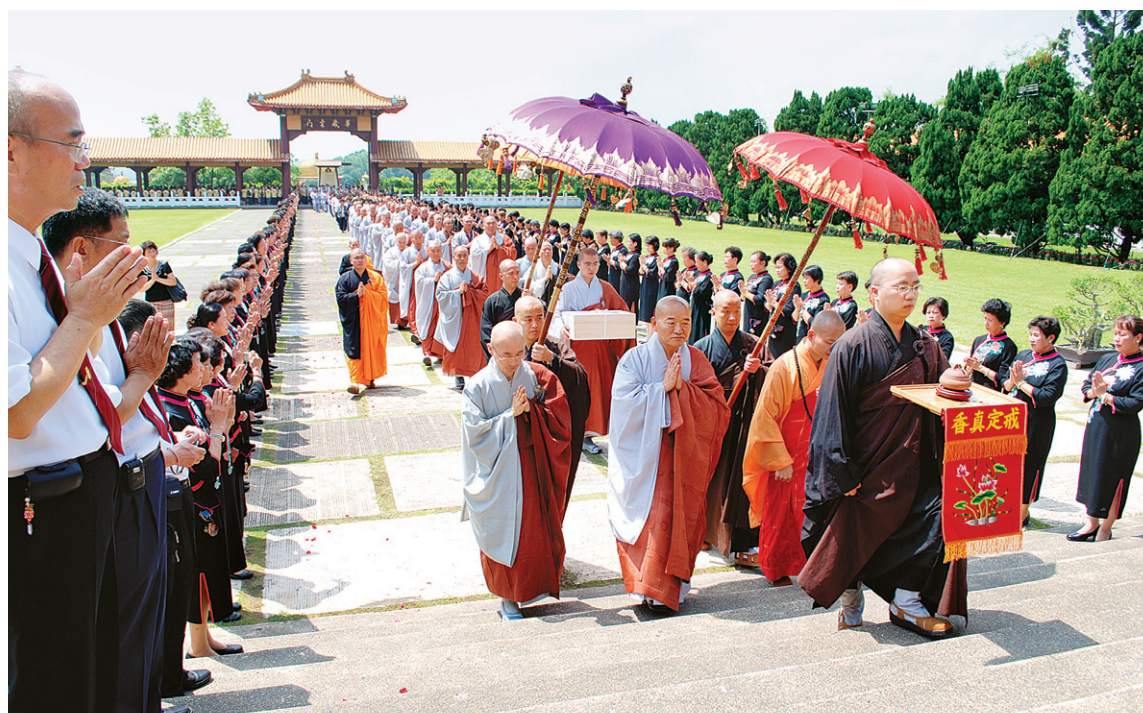
2009년 결연 사찰인 대만 불광산사에서 통도사 자장율사 금란가사 봉헌 모습.

스님의 차 마시는 모습에서 따뜻함이 변해 나왔다. "차를 마실 때 물은 가득차면 따라내야 넘치지 않습니다. 또 다 마셨으면 내려 놓아야 것이 순리 아니겠습니까." 노덕현 기자 noduc@ryunbul.com