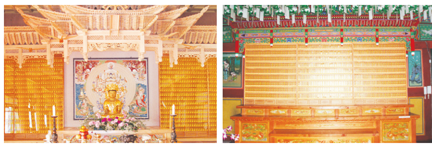
윤주사 LED 인등

찬덕불교가 개발한 새로운 개념의 신상품 영구위패 · LED 인등 · LED 전구