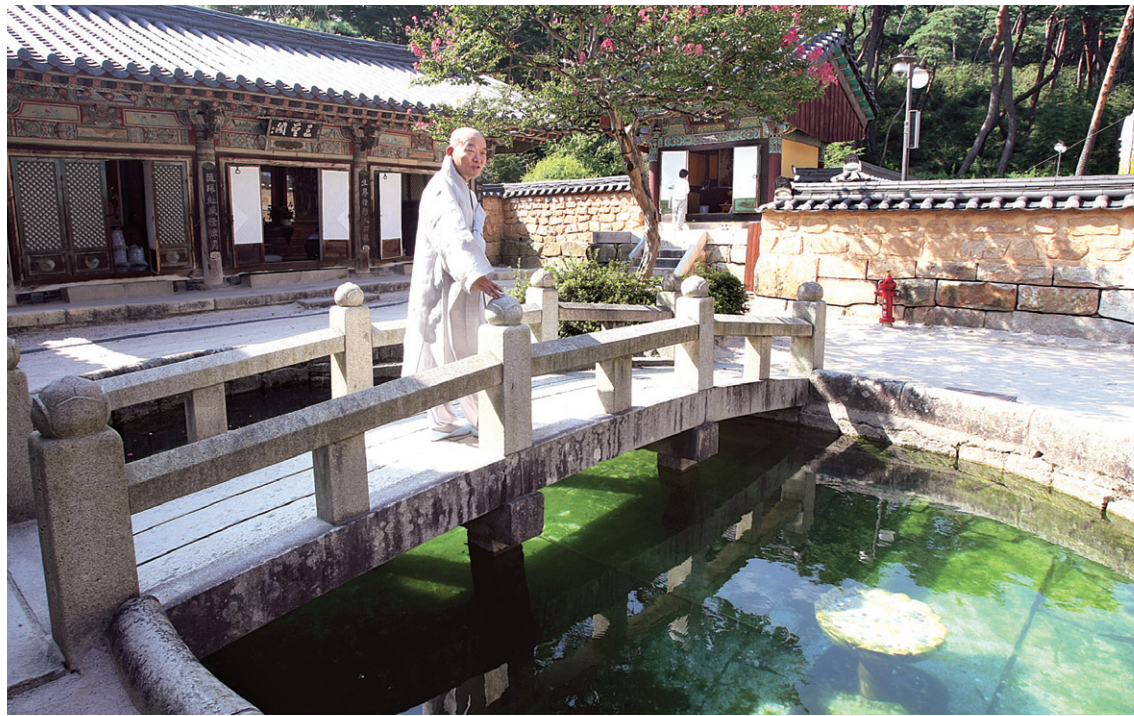
통도사 주지 당시 금강계단을 비롯한 사찰 곳곳을 불자들에게 개방했다.

스님은 여래사 불사 당시 여러 상황으로 사찰에 신경쓰지 못했지만 신도들이 힘을 모아 스스로 사찰 불사를 진행했다고 말했다. 스님은 “다시 돌아올 수 있었던 것도 신도들이 있어