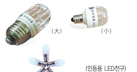
1년 365일, 하루 6시간 사용 전기요금 : 98원/1kwh