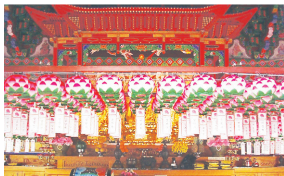
연등 자동 승강장치 _ 흥은사