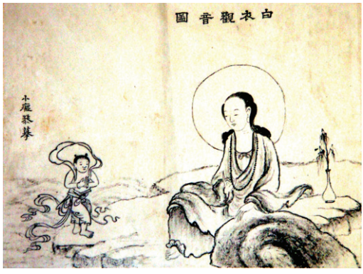
소치가 그린 백의관음도

고, 소사 부근 칠원사에서 초의를 만나 함께 하루를 묵은 후, 추사 댁을 찾았다. 소치는 당시의 상황을 “(추사를) 처음 만나는 자리였지만 마치 옛날부터 서로 아는 것처럼 느껴졌다. 추사 선생의 위대한 덕화가 사람을 감싸는 듯했다”고 회상했다. 이때 추사는 부친의 소상을 치른 후로 상중(喪中)이었다. 장동의 여막(廬幕)에서 추사의 아우 김명희와 김상희를 만났던 소치, 후일 추사의 형제들이 보낸 우정과 후원은 이로부터 촉발된 셈이다. 결과적으로 당대 유불예단(儒佛藝團)을 대표했던 인물 추사와 초의는 소치의 예술 세계에 밑거름이 되었는데, 초의의 초목법은 그의 운필법에 토대가 되었고, 추사의 가르침을 통해 그의 장대한 예술의 꽃을 피워냈다.