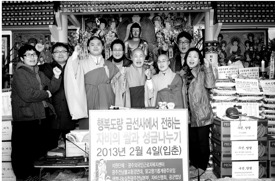
광주 금선사는 2월 4일 입춘을 맞아 자비의 쌀 2,400kg을 전달했다.

올해 첫 모금을 진행하고 있는 무등산 동원사(주지 지장)도 자비의 쌀을 2월 23일 지역불교계단체를 통해 환우가족과 독