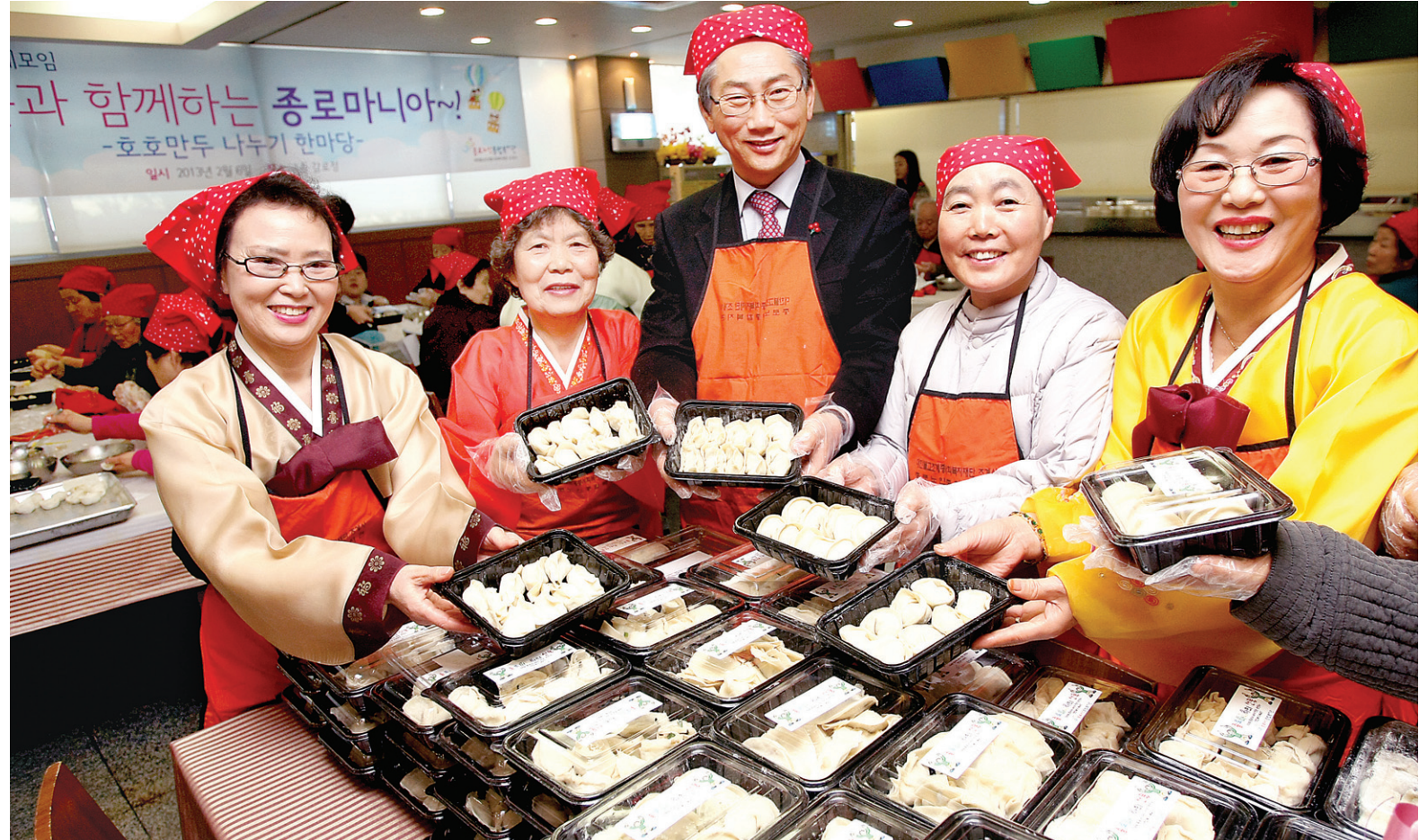
“소외계층과 함께하는 명절 되세요” 역 내 저소득층 어르신들에게 전달했다. 관련기사 5면