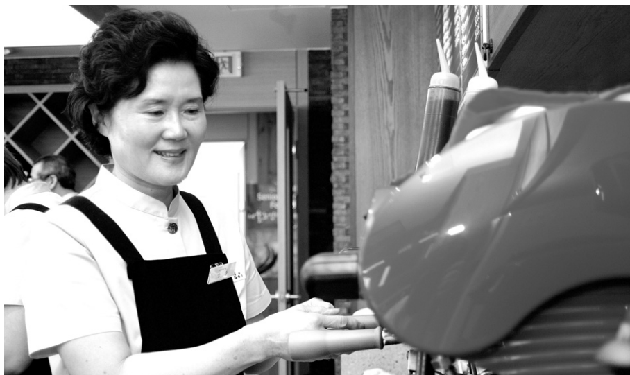
불교계 복지관들이 어르신들의 건강하고 활기찬 노후생활을 위해 노인일자리 사업을 실시해 참여자를 모집한다. 서울노인복지센터 북카페 '삼가연경'에 취업한 실버바리스타.

베이비부머의 은퇴가 본격화로 베이비부머세대가 700만이 넘는 시대를 맞았다. 경기 침체가 장기화 되면서 베이비부머의 은퇴도 점점 빨라지고 있는 추세다. 하지만 평생을 직장과 자녀양육에 몰두하며 지냈던 베이비부머 중 정작 본인의 은퇴 이후의 삶에 대해 진지하게 고민하고 준비한 사람은 거의 없다.