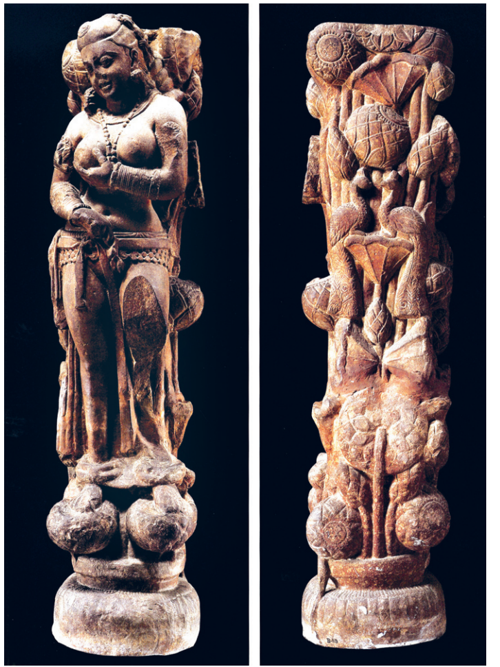
그림 ① 락슈미 상의 앞면과 뒷면

앞에서 본 락슈미상에서 배경을 지워버리면 우리나라 불화에서 보살이 영기화생하는 도상과 같다. 즉 만병에서 피어오르는 영기꽃이 생략된 셈이다. 우리나라 불화에서는 물이 생략되어 있을 뿐이지 여래와 보살 등은 모두 '물'에서 직접 화생하거나 물에서 피어오르는 영기꽃 갈래에서 나오는 연꽃에서 탄생한다. 우리는 지금까지 '연꽃 밑의 물과 영기' 문을 보지 못했을 뿐이다. 락슈미의 뒷면에서 앞부분의 락슈미상을 지워버리면, 이 만병은 강화도 정수사의 꽃살문의 만병과 같지 않은가! 2000년이 지난 오늘 날까지 인도의 락슈미의 영기화생의 도상이 한국의 18세기 꽃살문의 도상과 맥을 같이 하고 있으니 전통의 전승이란 놀라울 뿐이다.