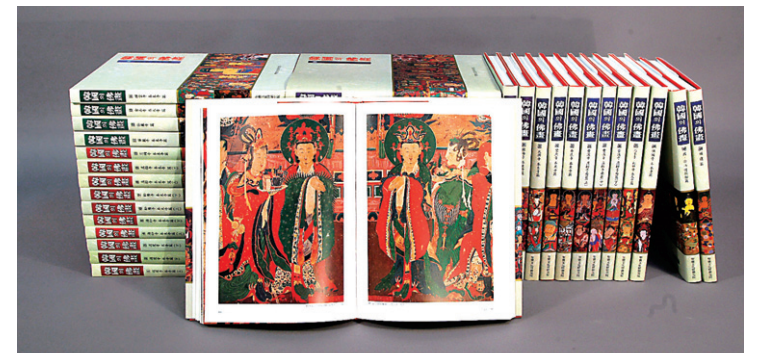
범하 스님이 이끈 불교성보문화재연구원은 2007년 한국의불화 시리즈 40권을 완간했다.