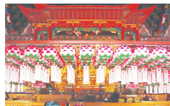
연등 자동 승강장치 - 흥은사

전선(케이블) 연등승강장치 天上列車 ※ 이계는 법당 연등 설치도 바른 하나로 해결하세요.