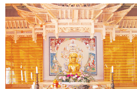
영주사 LED 인등

찬덕불교가 개발한 새로운 개념의 신상품 영구위패 · LED 인등 · LED 전구