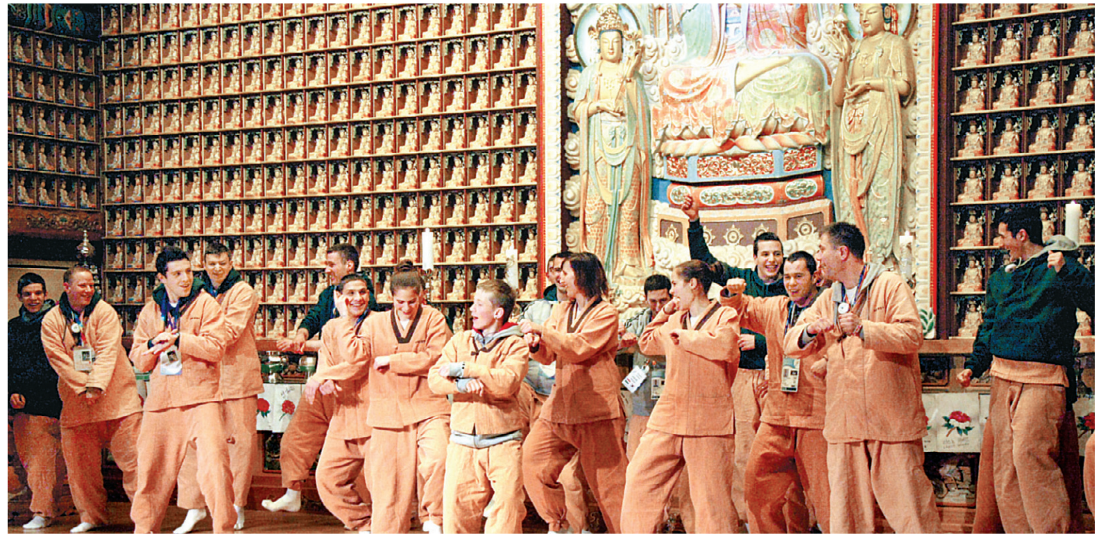
다함께 말춤... 장애의 벽도 넘다

평창에서 열린 '2013 동계 스페셜 올림픽' 출전을 위해 한국을 방문한 각국 대표선수단이 한국의 산사를 찾아 템플스테이를 체험했다. 1월 26일부터 29일까지 강원도 월정사에서 열린 이번 템플스테이는 한국을 처음으로 방문한 각국 선수단을 위한 '호스트 타운' 프로그램의 일환으로 진행됐다.