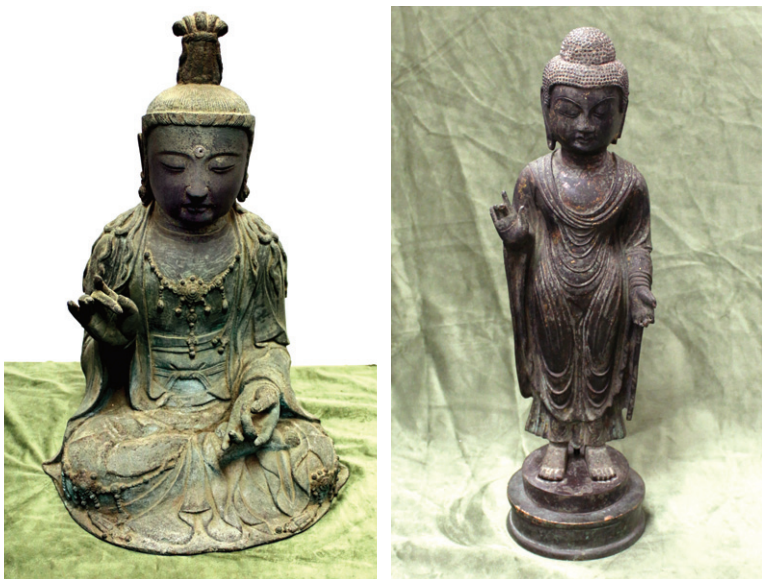
지난해 10월 일본 쓰시마의 신사와 절에서 도난당한 뒤 국내에 반입된 서산 부석사 관음보살좌상(좌)과 신라금동여래입상(우). 부석사 관음상의 경우 출처가 분명해 반환에 신중해야 한다는 목소리가 높다.

이에 대해 조계종 문화부(부장 진명)는 1월 31일 성명을 통해 “금동보살좌상은 복장 발원문을 통해 고