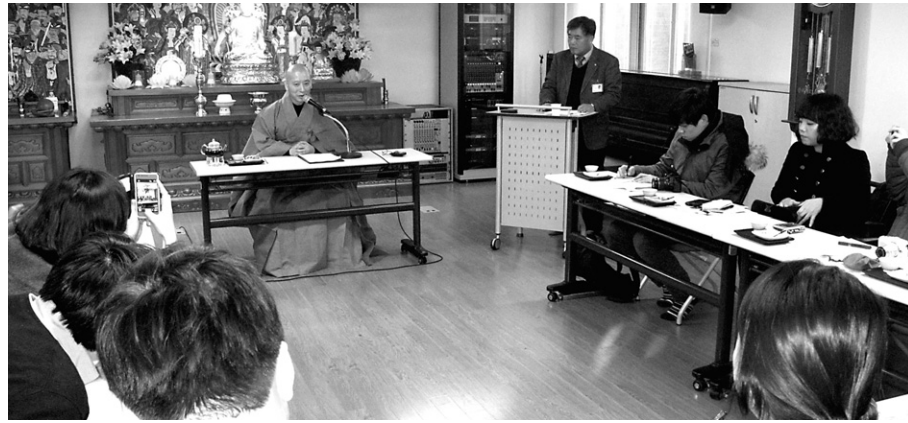
조계종 사회복지재단이 1월 23일 전법회관에서 기자간담회를 열고 신년 사업계획을 발표했다.

진각복지재단은 설립 15주년을 맞아 진각복지비전을 확립해 내실을 다져나간다. 재단은 “법인설립 15주년을 맞아 진각불교사회복지포럼을 개최하고, 비전수립을 위해 진각복지미래연구 TFT를 구성할 계획”이라며 “산하시설 경영성과평가를 통