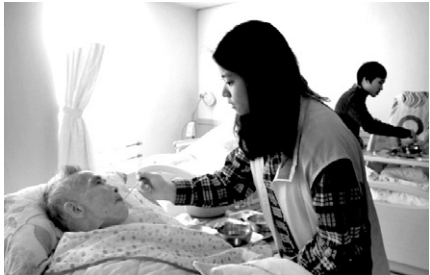
장애·비장애 청소년봉사단 WECAN 단원들이 노인요양시설을 방문해 봉사활동을 하고 있다.

청소년이라면 누구나 한번쯤 해야 하는 봉사활동을 보다 의미있게 할 수는 없을까. 철산종합사회복지관(관장 )은 장애·비장애청소년 통합자원봉사단 ‘WECAN’을 운영하고 있다.