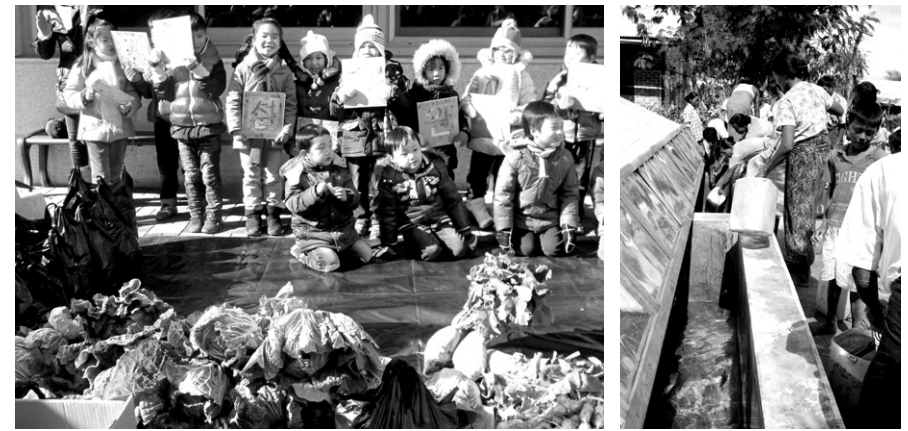
금당초등학교 초등학생들이 학용품 및 자신들이 텃밭에서 기른 채소를 팔아 모은 돈 118만원을 지구촌공생회에서 진행중인 미안마 식수지원사업에 기부했다(왼쪽). 주식회사 아이네임즈가 후원한 물탱크를 이용하고 있는 떼야도 마을 주민들(오른쪽).

지구촌공생회(이사장 율주)가 진행하는 미안마 물탱크 건립사업에 기업, 학교에서부터 개인까지 기부행렬이 이어지고 있다.