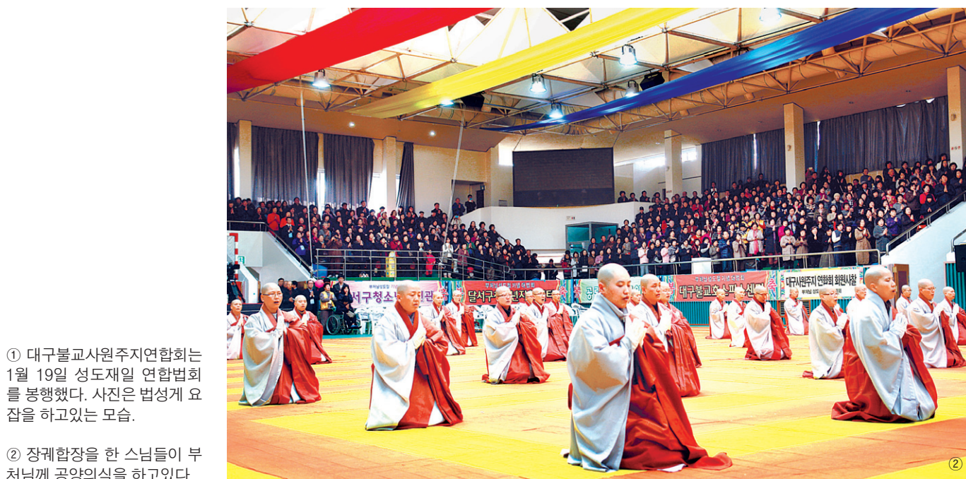
① 대구불교사원주지연합회는 1월 19일 성도재일 연합법회를 봉행했다. 사진은 법성도 요약을 하고있는 모습.