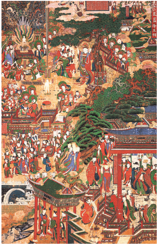
석가모니 부처님의 탄생을 담은 그림 '비람강생상(毘藍降生相)'. 성인(聖人)의 출생을 드러내는 다양한 전조(前兆)가 나타나 있다.

인간은 살아가는 동안 많은 '의례'를 치르며 산다. 책은 우리 민족이 수용한 불교와 우리민족의 일생의례, 즉 불교적 영향력 속에서 치르는 일생의례에 대한 연구다. 책은 종교적으로 정리되고 체계화된 측면에서의 일생의례가 아닌 민간에서 자생적으로 이루어지고 민족화된 불교, 민간에서 적극 수용한 불교를 통해 출생, 혼례, 회갑례, 상례, 제례의 다섯 가지 주제의 의례양상을 다뤘다. 이를 통해 우리 민족은 출생에서 죽음에 이르는 과정에서 삶의 중요한 시점에 불교를 적극적으로 수용해 왔음을 알 수 있다.