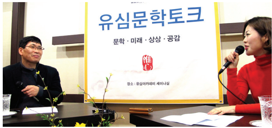
유심문학토크는 박형준 시인을 초대해 시인의 시 세계를 탐구하는 시간을 가졌다.