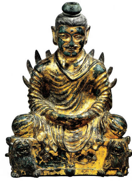
그림① 중국 금동불

반드시 연꽃 형태에 갖가지 영기꽃을 부여하며 영화된 연꽃, 즉 영기꽃에서 고귀한 존재가 화생하는 도상들이 끊임없이 만들어왔다. 그러므로 바로 이 경전에 나오는 '연화화생' 이란 말 때문에 연꽃이 영화된 까닭도 알 수 없었고, 그 밖에 '무한히 다양하게 전개하는 화생하는 방법' 을 나타낸 도상이 보이지 않게 되었으니 경전의 용어가 화생을 파악하는데 오히려 큰 걸림돌이 된 것이다. 조각이나 회화에서는 여래나 보살 등은 반드시 연꽃 위에 앉아 있거나 서 있다. 그러나 이제부터는 그런 식으로 말하면 안 되고 '여래나 보살이 연꽃에서 화생하는 광경' 이라고 논문에서 써야 한다. 나 자신도 10년 전에는 연화화생의 의미를 확실하게 몰라 그렇게 써왔었지만 그렇게 쓰면 틀린 말이다.