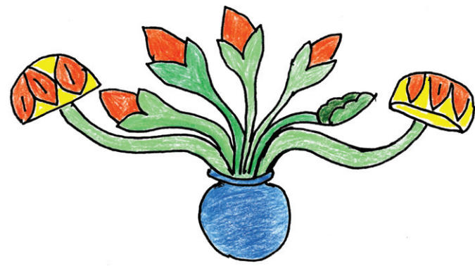
그림③ 만병 채색 분석

그러면 연꽃이란 무엇인가? 연꽃은 누구나 다 알고 있다. 경전에 수많은 등장하고, 조형미술에도 수많은 등장하고 있으니 연꽃을 보고 불교를 떠올릴 만큼 불교의 상징이 되어 버렸다. 그런데 바로 이 고정된 관념이 불교미술을 이해하는데 역시 큰 걸림돌이 되고 있다. 즉 연꽃만 보이지 다른 꽃은 쳐다 보지도 않고 보이지도 않는다. 그런데 연꽃만이 성스럽고 물을 상징하는 것이 아니다. 연꽃뿐만 아니라 모든 꽃은 아름답고 물이 없으면 자라지 못하고 꽃도 피우지 못하므로, '모든 꽃에서 여래나 보살이 탄생' 할 수 있다고