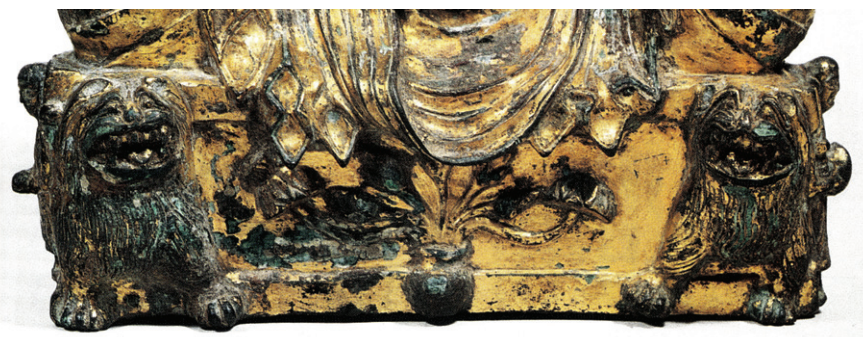
그림② 중국 금동불 대좌 부분