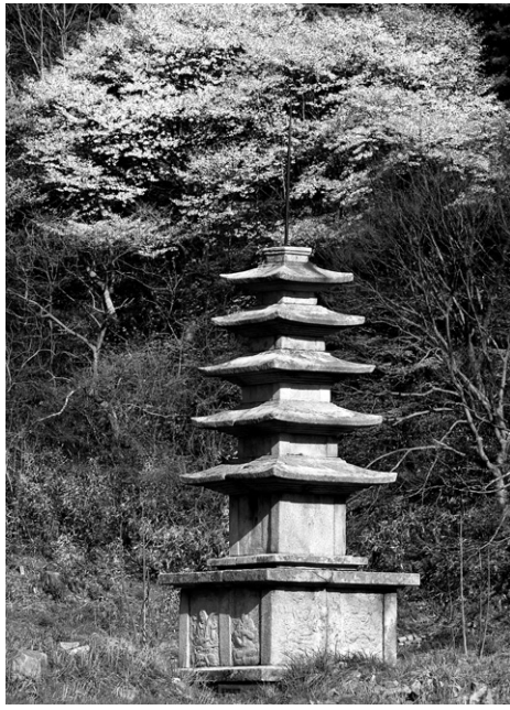
보물 제104호인 보원사터 5층석탑

더구나 고려 당시에는 교종을 통치사상으로 내세운 중앙정부가 지방의 선종 세력을 견제하기 위해 충청도 지역에 화엄사찰들을 여럿 세우기도 했으니, 그 만남과 통합 과정은 더욱 치열할 수밖에 없었다. 죽산-충주 국도변에 산재한 고려 전기 양식의 거대한 석불입상들이 고려 중앙정부(교종)와 호족세력들(선종)의 과시적 합작품이라면, 고려 양식과 통일신라 양식이 조화롭게 녹아 있는 서산 보원사터의 탁월한 5층석탑은 그 통합의 예술적 극치다.