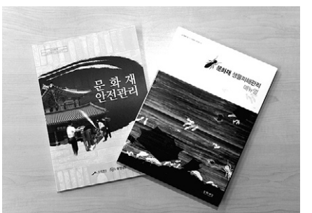
문화재 안전관리 교육교재

이번에 문화재청이 개발한 매뉴얼과 교재는 사찰방재예측시스템을 도입하고 있는 불교계에도 큰 도움을 줄 것으로 보