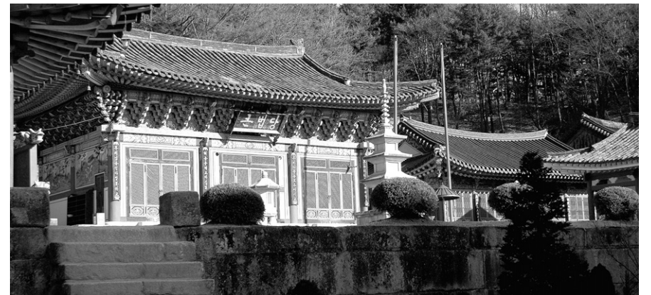
봉선사 큰법당. 대웅전을 한글로 번역해 ‘큰법당’이라 이름 붙여졌다.