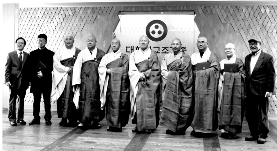
조계종은 1월 7일 조계종 총무원청사에서 제 5기 국제교류위원회에 위촉장을 수여했다.

주사는 ‘소중한 참 나 알기 템플스테이’를 통해 자신의 소중함과 가치를 일깨우는 시간을 갖는다. 매주 주말 실시하는 이번 프로그램은 용주사 사찰부어, 발우공양, 산행 등 전통문화 체험과 함께 1박 2일간 포행, 108배 등을 통해 나를 돌아보고, 스님과의 대화를 통해 상담의 시간을 가질 예정이다. (031)234-0040 경기도 화음사는 ‘허심탄회(訥) 템플스테이’라는 주제로, 학교, 기업 등 단체 참가자를 대상으로 특화된 프로그램을 선보인다. 소금 만다라 만들기, 윤력, 숲속 포행, 발우공양을 비롯해 나만의 열쇠고리 제작 등 주변사람들과 마음으로 나누고, 친목을 도모할 수 있는 시간을 전한다. (031)335-2576 이 밖에도 마곡사의 ‘술바람 숲길 템플스테이’, 전등사의 ‘休- 템플스테이’ 등 전국의 다양한 사찰에서 힐링을 위한 템플스테이 프로그램을 만날 수 있다. 문의의 www.templestay.com 신종일 기자