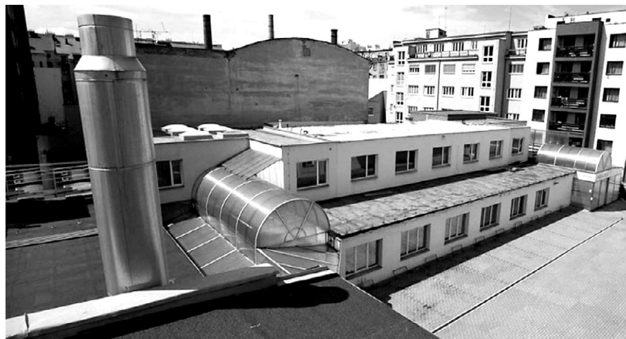
곰파 프라하가 들어선 옛 산업 시설 전경. 그 옆으로 공동주거시설 등이 보인다. 프라하 홀레쇼비체 지역에서는 현재 버려진 산업 시설을 주거·금융시설로 리모델링하는 붐이 한창이다.

"체코불교계는 이렇게 광범위한 프로젝트를 처음 진행한다"고 전한 이안 조직위원장은 "곰파 프라하는 사람들이 차를 가