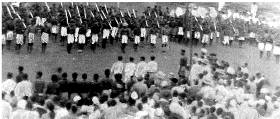
암베드카르는 불가촉천민들과 함께 계급해방에 앞장섰다.

고 있었다. 그래서 '평등사회모임'이라는 조직을 결성해 불가촉천민과 다른 카스트간의 식사나 결혼 등을 주선하려는 노력도 했다.