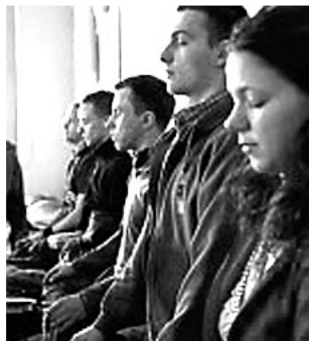
프라하 소재 티벳불교계 금강불교센터에서 진행되는 대중법회에 동참한 체코 현지 불자들의 모습.

에서 학문적 접근을 하는 차원에서 율트기 시작했다. 이후 사회주의 체제 속에선 뚜렷한 활동이 없다가 구소련 체제가 무너진 1990년대 학문의 영역을 넘어 대중에게 다가가기 시작했다.