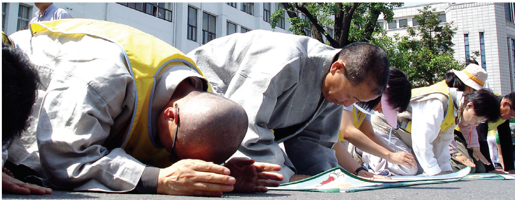
2002년 진행된 여성 종교인들의 공권력 오남용 근절 시위(사진 위)와 2008년 불교계를 중심으로 진행된 생명평화탑발순례(사진 아래). 진정한 생태사회가 되려면 개인의 폭력뿐 아니라 구조적인 폭력에서 벗어나야 한다.

일한 수준에서 싸우는 것이 아니라 상대방보다 한차원 높은 곳에서 상대를 안타까워하며 그를 구제하겠다는 자비의 발심을 가질 때야만 가능한 것이다. 싸움에서 설령 이겼다고 해도 상대방이 적개심과 저항의지를 포기시키지 못했다면 완전히 승리한 것이 아니기 때문이다.