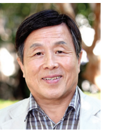
저자 · 방민준

저자 방민준은 30여 년간 언론인으로 활동했다. 골프의 정신세계를 조명한 에세이집 <달마가 골퍼채를 잡은 까닭은?> 등을 펴냈다.