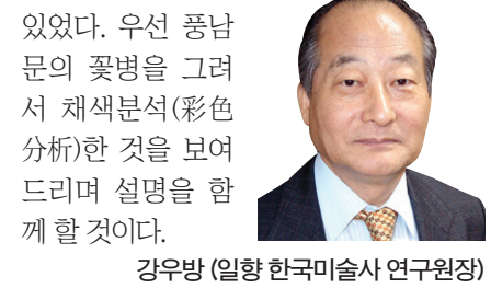
강우방 (일할 한국미술사 연구원장)

채색분석하여 보니 놀랄게도 영기문(靈氣文)이 발산하여 나오는 광경이었다. 영기문이란 우주에 충만한 대생명력을 가시화한 갖가지 조형을 나는 영기문이라 이름 지었다. 사람들에게 보이지 않는, 그래서 무엇인지 모르는 것은 이름이 없다. 그래서 깊이 생각하면서 그런 조형에 내가 이름을 붙여나갈 것이니 여러분은 정독하여 주시기 바란다. '우주에 충만한 대생명력'이나 '우주에 충만한 성령(聖靈)'이나 '삼천대천세계(우주)에 가득 찬 여래' 등 모든 종교에서 말하는 것은 같은 의미이다. 여래는 한 마디로 '생명'이다. 생명의 근원이어서 만물을 생성시킨다. 바로 그 갖가지 영기문이 화반에서 쏟아져 나오는 것이다. 그 때부터 나는 꽃병이 아니고 다른 성격임을 짐작하였다. 그러면서 나는 점차 '대생명력이 가득 찬 병' 즉 만병(萬病)이라는 만물생성의 근원이라는 도상에 조금씩 다가가고 있었다. 우선 풍남문의 꽃병을 그려서 채색분석(彩色分析)한 것을 보여드리며 설명을 함께 할 것이다.