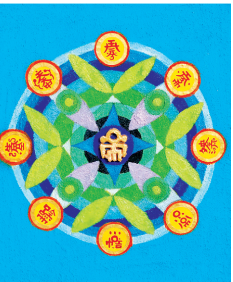
김인섭 작가는 오방색을 응용한 만다라 20여 점으로 관람객들을 찾는다.