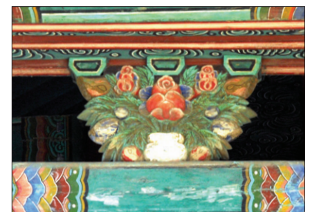
풍남문 만병 화반

그런데 가운데 7년 전 어느 날 밤, 조명을 받으며 뚜렷하게 보이는 전주 풍남문(豐南門)의 화반에서 꽃병을 보았는데 이 꽃병에서 나오는 것이 꽃이 아니었다. 이튿날 아침 사진을 찍어서 돌아와 그려보고