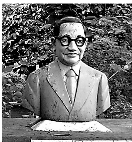
인도 델리대학교 교정에 있는 암베드카르 동상

은 영국의 인도 지배를 계기로 다른 직업을 가질 수 있게 되었고 암베드카르의 아버지도 영국군대에서 근무하게 됐다. 자식교육에 열의가 대단했던 암베드카르의 아버지는 누이의 귀금속을 저당 잡혀서라도 아들의 책을 사주곤 했다. 그런 아버지 덕분에 그는 고등학교를 졸업했고 이는 불가촉천민에게는 매우 드문 일여서 축하모임이 열렸다. 열심히 공부하던 암베드카르를 눈여겨보고 있던 고등학교의 교장선생님이 이 모임에 참석해 한 주정부의 장학금을 추천해주었다. 이 장학금으로 그는 대학을 졸업했고 해외유학까지 떠날 수 있었다. 미국에서 박사학위를 받고 영국에서 공부하던 1917년에 그는 장학금을 지급한 주정부의 부름을 받고 귀국하여 주정부에서 근무를 하게 된다.