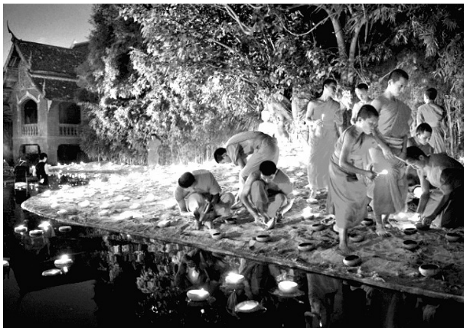
태국의 북쪽에 위치한 치앙마이(Chiang Mai) 체디루앙사(Wat Chedi Luang)의 ‘소년 스님(단기출가)’들이 연못에 등을 밝히고 있다. 태국의 현대화가 진행되면서 단기 출가 대신 태국 정부가 지원하는 대체 교육에 참여하는 소년들이 늘어나고 있다. 이는 태국 스님 수를 감소시키는 원인이라는 지적이다.

대중스님, 배달음식으로 식사챙겨 사찰 재적 승려 줄고 권위 퇴색돼 여과없는 스님 스캔들 보도가 문제