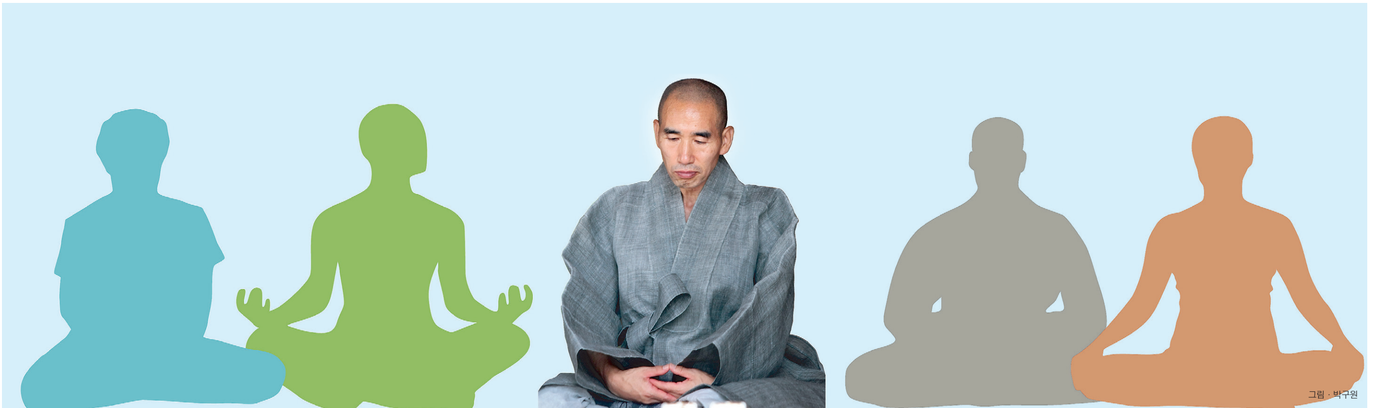
그림 · 박구원